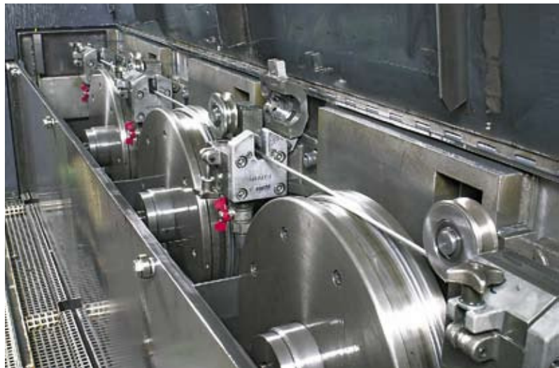
Mittelzugmaschine Typ MSM224: Blick in das Ziehbecken mit elektronisch gesteuerten Ziehscheiben

Gutmann wires are also visually impressive. The new administrative building of the world football association FIFA in Zürich, handed over for use in May 2007, is clad with a wire fabric. The fabric, covering several thousand square metres of façade surface, is intended to resemble a football net and creates fascinating