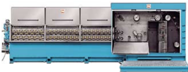
Mehrdrahtziehmaschine MMH104 für Draht aus Aluminium und Aluminiumlegierungen