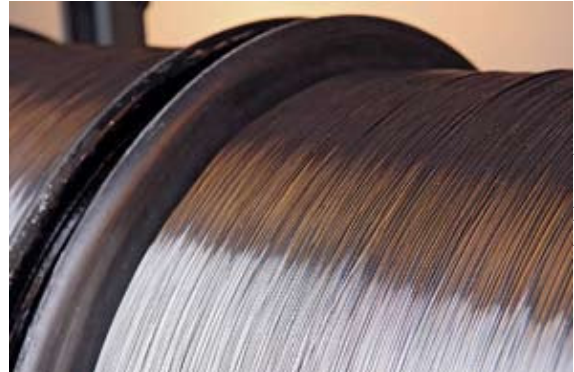
Aufgespulter Aluminium-Runddraht aus der 5000er-Legierungsgruppe auf dem Weg zur Weiterverarbeitung

Wire is produced when a metallic rod is rolled to small diameter and then drawn through drawing dies with progressively smaller apertures. Due to the properties typical of aluminium – low density with comparatively high strength compared with other important metals, good corrosion resistance, favourable mechanical properties which can be varied widely by alloying, high electric and thermal conductivity as well as non-toxicity and inodorousness – the metal is used in the form of wires and wire products as well for many applications. Wire manufacturers, who have specialised in the processing of aluminium rod wire, offer bars, rods and wires of unalloyed aluminium and up to 60 different wrought alloys. In the German-speaking area there are only a handful of such operations. One of these is Gutmann Aluminium Draht GmbH (GAD) in Weißenburg, which has been active in this field for more than 70 years.